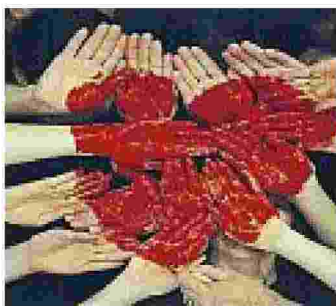
Tra le installazioni un grande cuore che pulserà in base alle frequenze dei visitatori