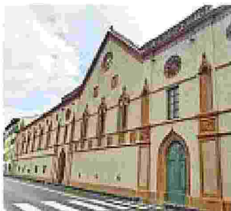
L'esterno dell'ex convento, ora diventato un centro congressi dell'Università di Pisa