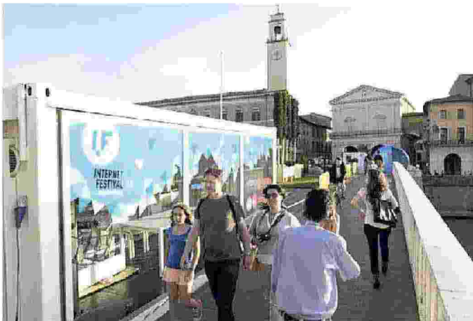
Un allestimento dell'Internet Festival sul Ponte di Mezzo a Pisa

Diretto da Claudio Giua, Internet Festival-Forme di Futuro, giunto alla settima edizione, è organizzato dal Comune di Pisa, dalla Regione Toscana, dall'Università di Pisa, dalle scuole Normale e Sant'Anna, dal Cnr . Circa 200 gli eventi, le performance, le installazioni, le presentazioni in calendario, in una quindicina di location nel cuore della città.