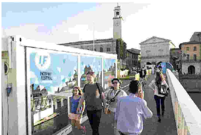
Un allestimento dell'Internet Festival sul Ponte di Mezzo a Pisa

Diretto da Claudio Giua, Internet Festival-Forme di Futuro, giunto alla settima edizione, è organizzato dal Comune di Pisa, dalla Regione Toscana, dall'Università di Pisa, dalle scuole Normale e Sant'Anna, dal Cnr. Circa 200 gli eventi, le performance, le installazioni, le presentazioni in calendario, in una quindicina di location nel cuore della città.