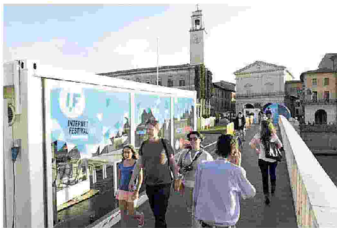
Un allestimento dell'Internet Festival sul Ponte di Mezzo a Pisa

Diretto da Claudio Giua, Internet Festival-Forme di Futuro, giunto alla settima edizione, è organizzato dal Comune di Pisa, dalla Regione Toscana, dall'Università di Pisa, dalle scuole Normale e Sant'Anna, dal Cnr. Circa 200 gli eventi, le performance, le installazioni, le presentazioni in calendario, in una quindicina di location nel cuore della città.