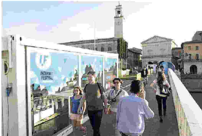
Un allestimento dell'Internet Festival sul Ponte di Mezzo a Pisa

Diretto da Claudio Giua, Internet Festival-Forme di Futuro, giunto alla settima edizione, è organizzato dal Comune di Pisa, dalla Regione Toscana, dall'Università di Pisa, dalle scuole Normale e Sant'Anna, dal Cnr. Circa 200 gli eventi, le performance, le installazioni, le presentazioni in calendario, in una quindicina di location nel cuore della città.